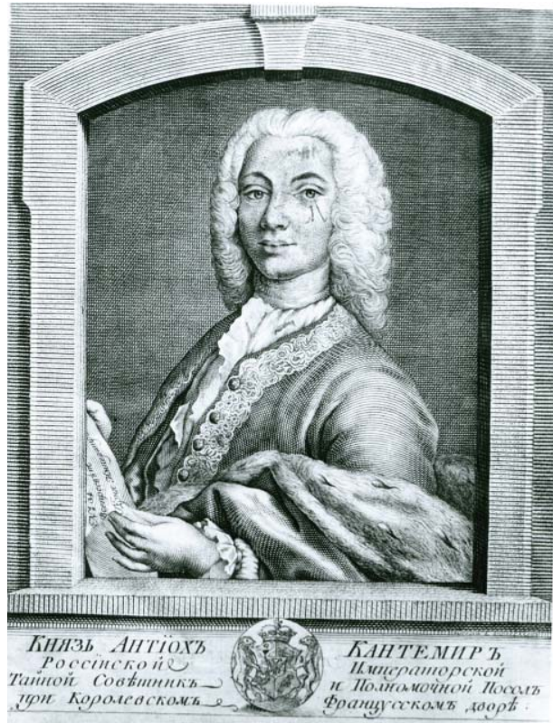
Antioh Cantemir, gravură de E. G. Vinogradov după originalul lui Vagner. Londra, 1938

Educația și instrucția lui Antioh începe în casa părintească. Primele studii le face sub îndrumarea tatălui și a profesorilor particulari. Concomitent cu instruirea în casa părintească, viitorul poet frecventează Academia slavo-greco-latină din